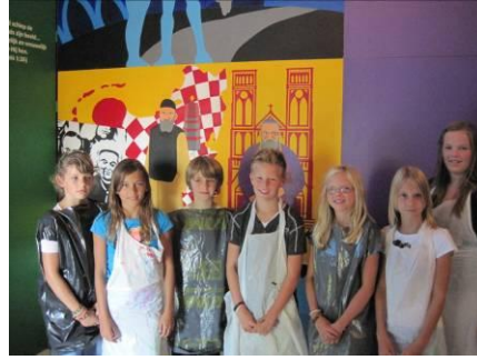
en op de foto...