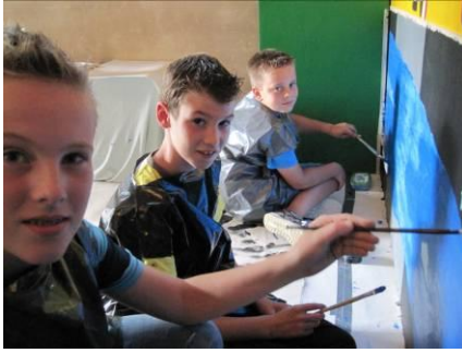
En dan aan de slag...