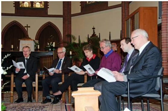
Zingend wordt de H. Geest aangeroepen.